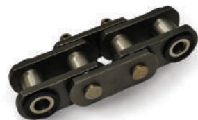
OPÇÕES DE CORRENTE DE ARTICULAÇÃO VEDADA