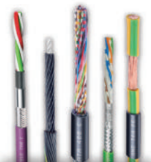
CABOS FLEXÍVEIS CONTÍNUOS