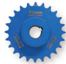
RODAS DENTADAS SMART TOOTH®