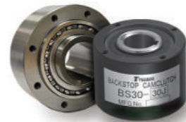
CONTRA-RECUOS E EMBREAGENS DE GIRO LIVRE