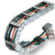
TRANSPORTADORES DE CABO DE AÇO