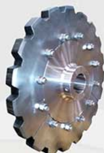
Sprocket de aço inoxidável