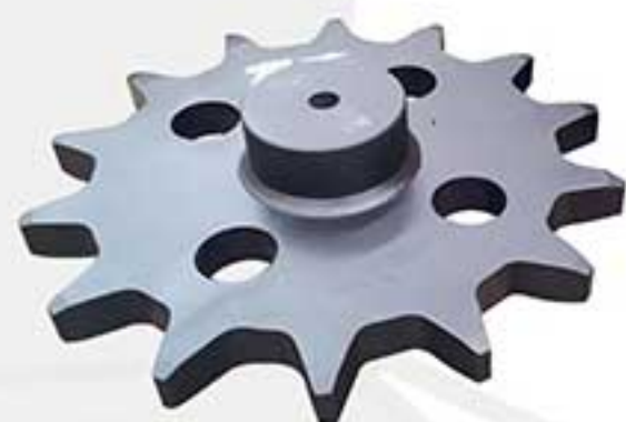
Dente tipo motriz