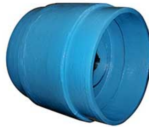
Roda tipo Tambor para tração