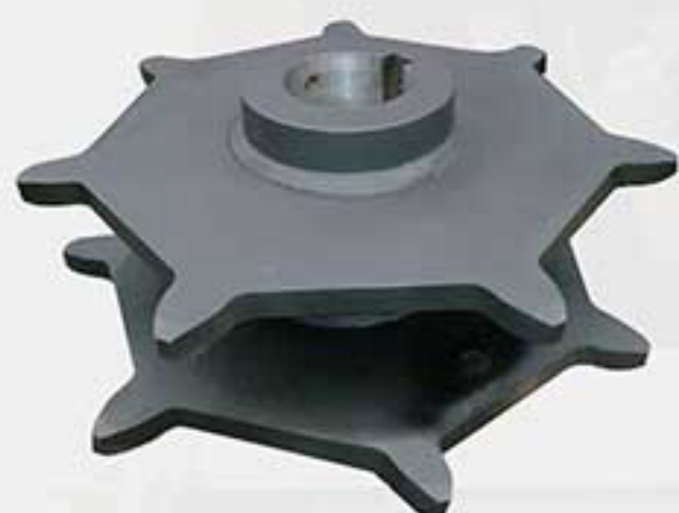
Sprocket para tratamento de águas residuais