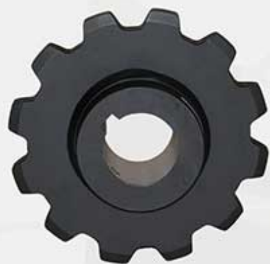
Dente tipo transportador